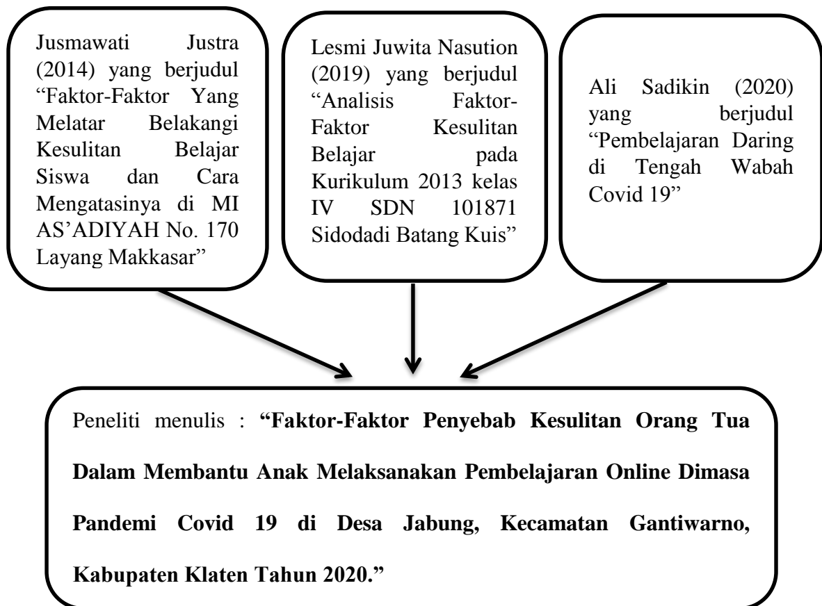
Gambar 1. Bagan keaslian penelitian