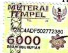
YUDI HERNAWAN ANGGRIANTO